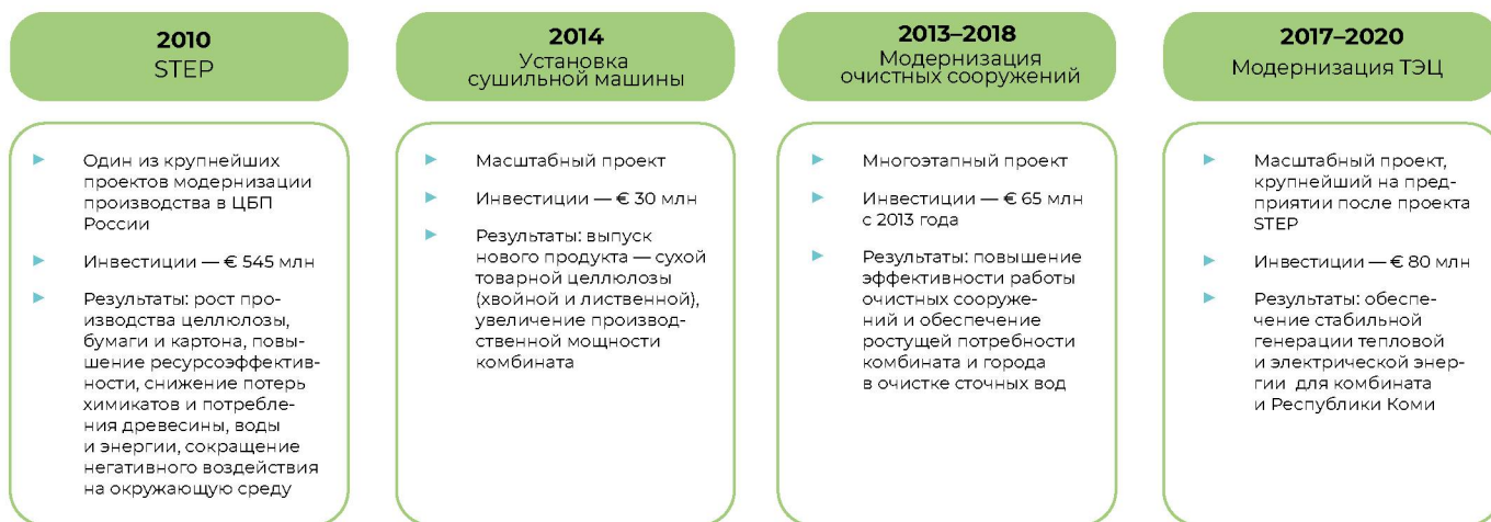
РИС. 3. Стратегические проекты АО «Монди-СЛПК».