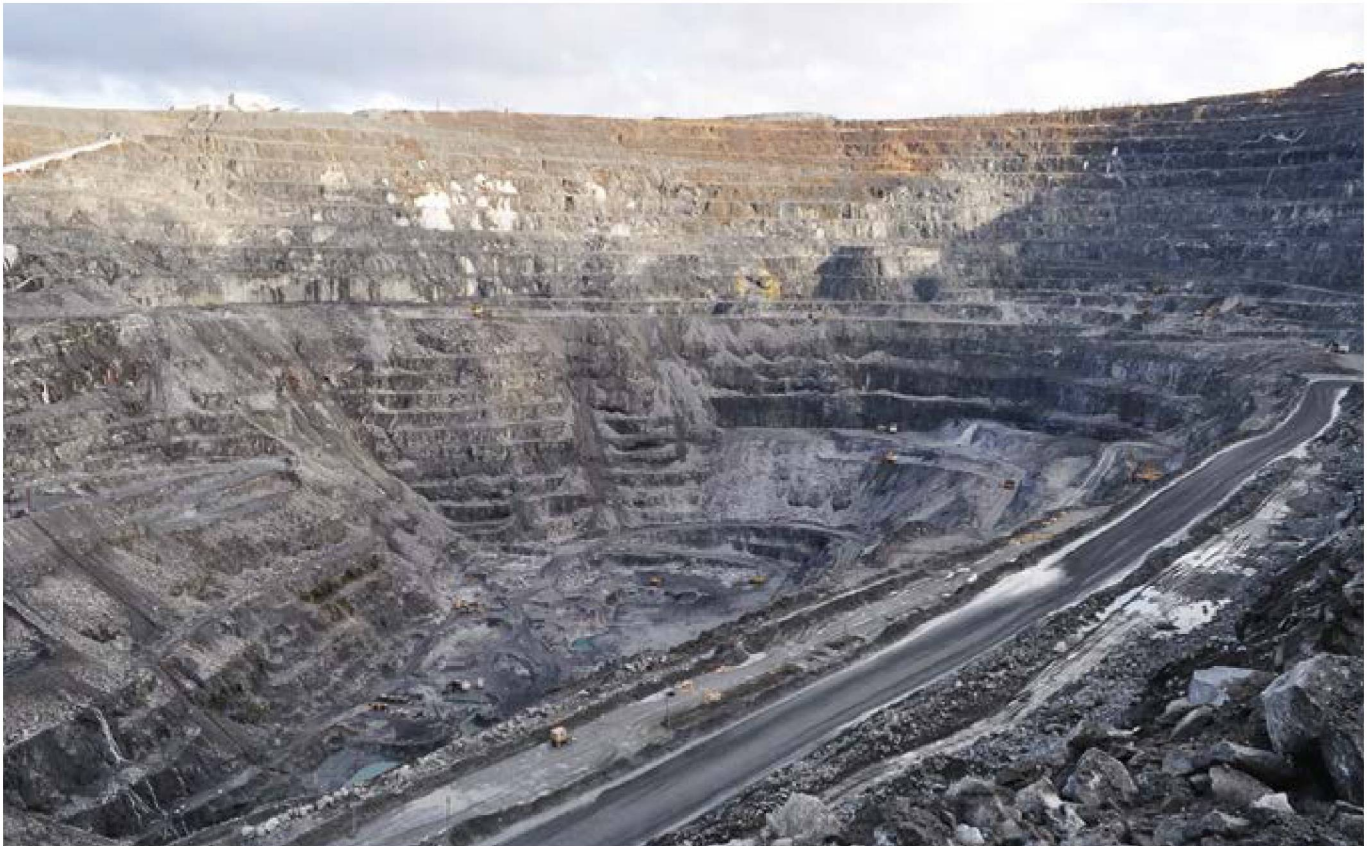
РИС. 4. Панорама Ковдорского горно-обогатительного комбината.

выбросов парниковых газов и углеродного следа продукции — параметров, играющих все более значимую роль в международной конкуренции.