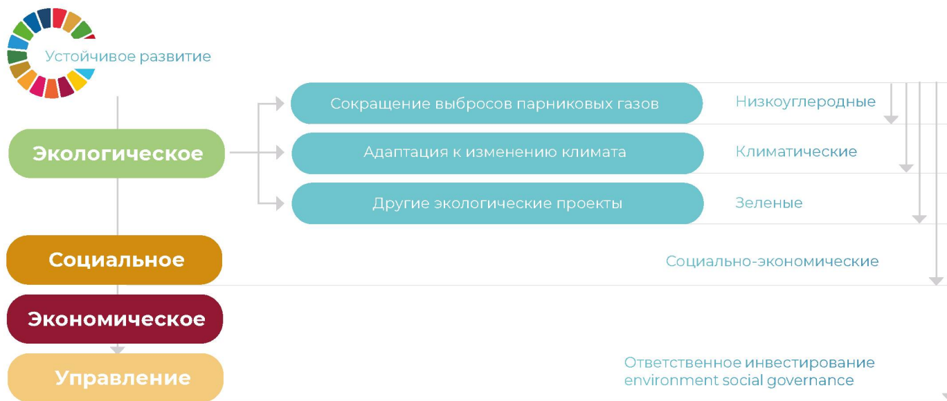
РИС. 2. Приоритеты ответственного инвестирования.

и были направлены на повышение конкурентоспособности компании. При этом критериями выбора технологических решений служили международно принятые требования НДТ, что способствовало формированию общественного диалога и взаимопонимания между заинтересованными сторонами.