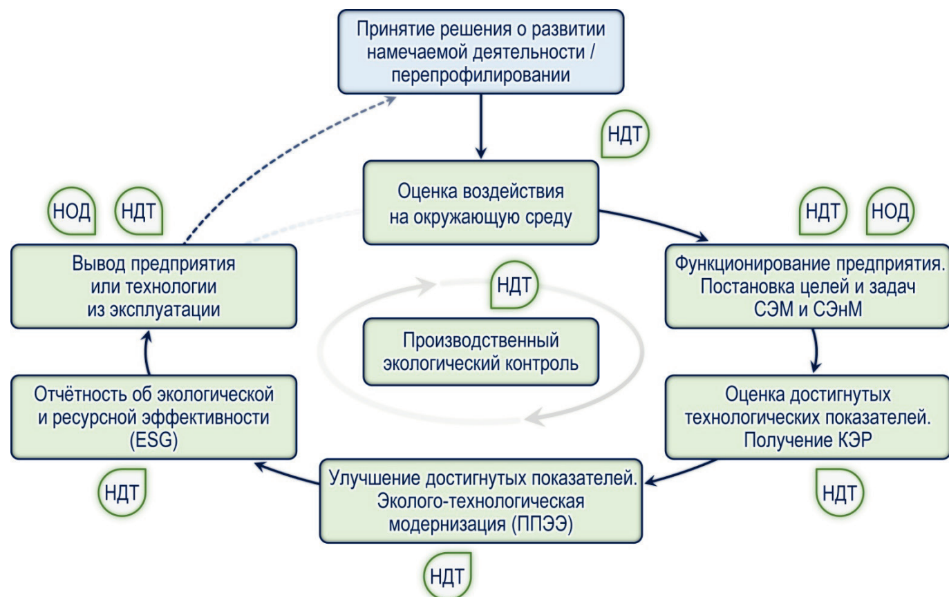
Рисунок 1 – Применимость концепции наилучших доступных технологий на всех этапах жизненного цикла промышленного предприятия

о том, что последовательное сближение концепций НДТ и зелёной химии создаёт условия для развития социально-экологической отчётности предприятий.