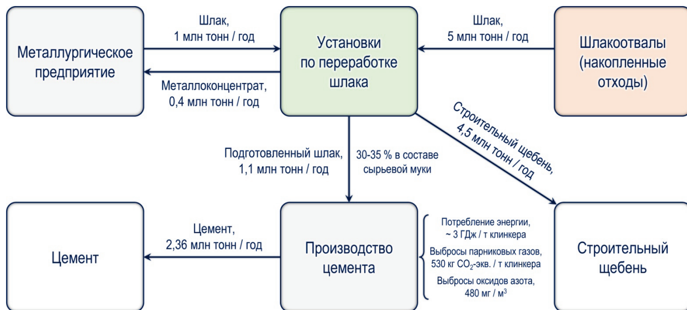
Рисунок 4 – Экологическое ситуационное исследование: производство цемента в соответствии с требованиями наилучших доступных технологий

– НДТ 11а и 11е: снижение выбросов \text{NO}_x в отходящих печных газах (оптимизация процесса обжига и применение технологии селективного некаталитического восстановления оксидов азота); технологический показатель НДТ \leq 500 \text{ мг NO}_x/\text{м}^3 .