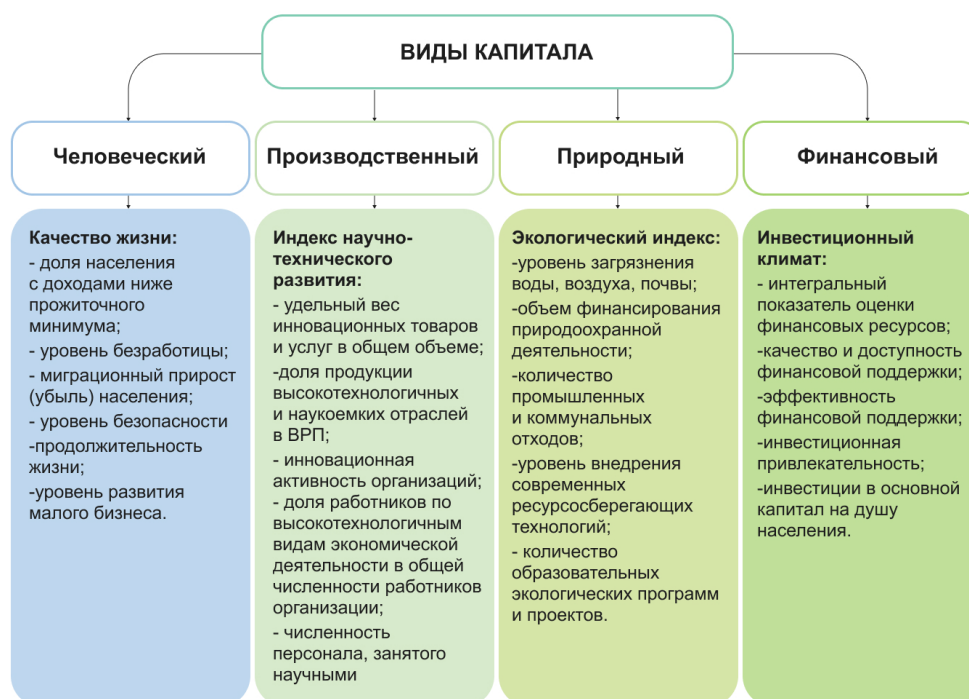
Рис. 1. Система показателей, характеризующих устойчивость территориально-промышленной экосистемы (составлено авторами)

на основе энтропийного подхода» [17]. Территориально-промышленная экосистема является сложной открытой системой. Открытые системы функционируют на принципах самоорганизации, что обеспечивает свободный вход и выход акторов в экосистему и, соответственно, образование новых связей [12]. В. Гейзенберг и А. Поздняков внесли значительный вклад в развитие методологии оценки систем, предложив теорию центрального порядка. «Самоорганизация акторов экосистемы территории возможна лишь тогда, когда существует негэнтропийный поток энергии (информации, знаний, компетенций, технологий, инноваций) из внешней среды, на который не требуется затрат энергии, вырабатываемой самим актором» [18]. К. Шеннон ввел понятие «мера энтропии экосистемы» [19]. Авторы адаптировали данное понятие для социально-экономических систем и разработали методический подход к оценке уровня использования совокупного капитала территориально-промышленной экосистемы (рис. 1).