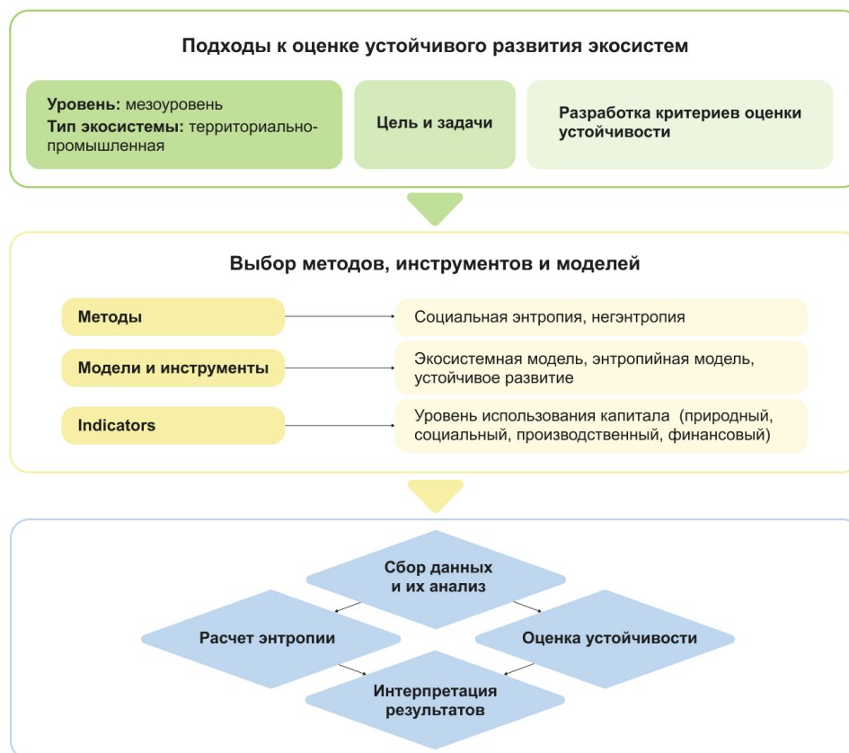
Рис. 2. Алгоритм оценки уровня устойчивости территориально-промышленной экосистемы (составлено авторами)

Оценка уровня финансового капитала проведена на основе расчета интегрального показателя инвестиционного климата по методике, предложенной Агентством стратегических инициатив [21].