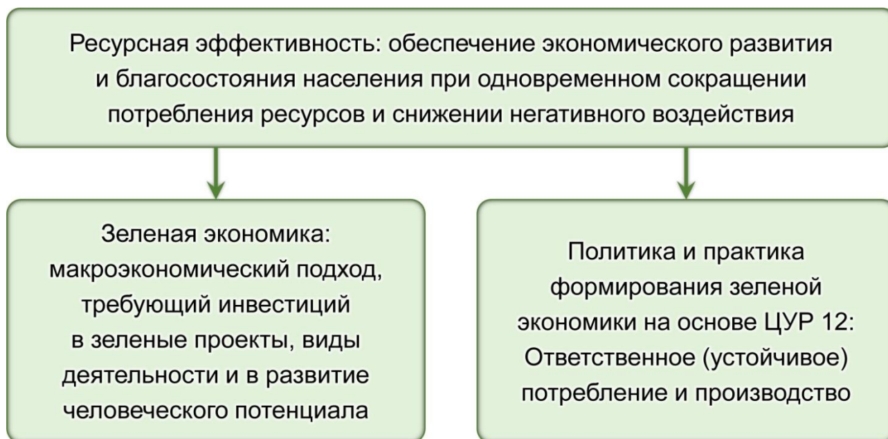
Рисунок 1. Взаимосвязь зеленой экономики и повышения ресурсной эффективности производства и потребления (рисунок составлен авторами на основе 9 )

Эксперты ООН подчеркивают особую значимость ЦУР 12 «Ответственное (устойчивое) потребление и производство» в контексте формирования зеленой экономики и раскрывают основные направления достижения этой цели 10 :