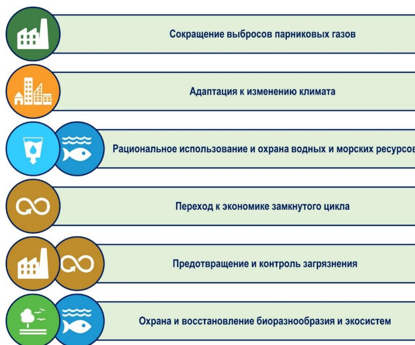
Рисунок 2. Приоритетные направления таксономии зеленого финансирования в Европейском союзе (составлено авторами по 10 )

Как и следовало ожидать, таксономия отражает приоритеты «Зеленого пакта» (Green Deal 14 ):